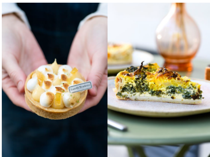
Tarte citron meringuée

Exemples de recettes réalisées avec YUMGO poudre ou liquide en vente dans les boulangeries Land & Monkeys